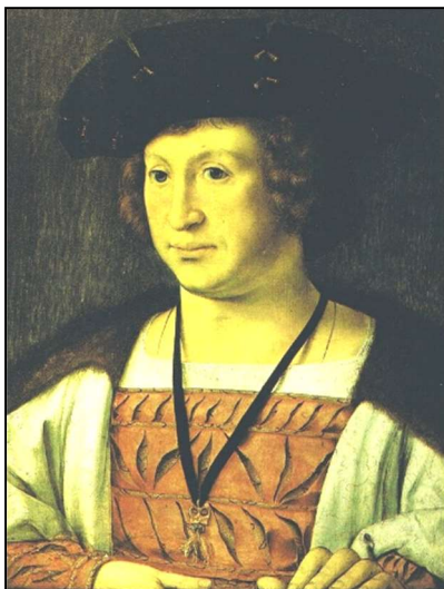
Floris van Egmond 1649-1539

Floris van Egmond woonde op het kasteel te Buren. Hij was Markies van Veere, Graaf van de graafschappen Buren en Leerdam, Baron van de Heerlijkheid de baronie van Acquoy en Heer van IJsselstein. Voogd van de jonge Karel van Habsburg (Karel V) etc. etc. Floris was een machtig en rijk man, van hoog aanzien. Na zijn overlijden in 1539 gaan zijn bezittingen en titels over op zijn zoon Maximiliaan van Egmond. En als Maximiliaan overlijdt in 1548 gaan al zijn bezittingen en titels over op zijn kleindochter Anna van Egmond (Anna van Buren). Anna trouwde in 1551 met Willem I van Oranje. Zodoende werden de Oranjes baron van Acquoy. Welke titel onze koning Willem Alexander nog heden mag voeren.