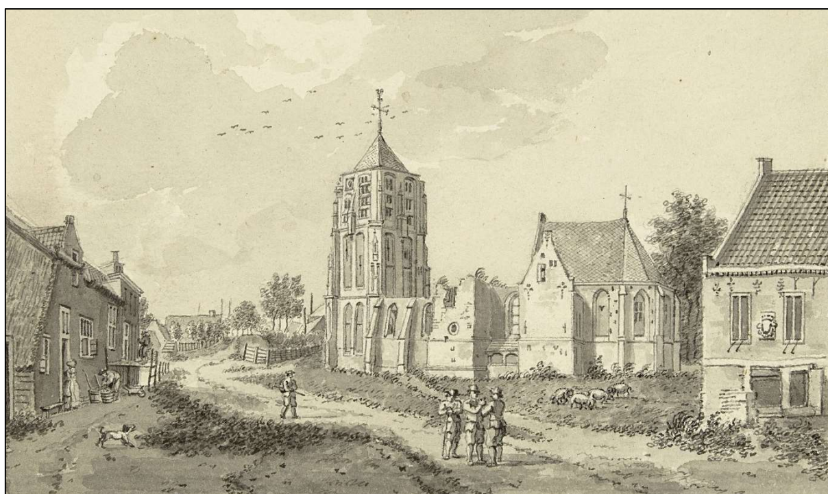
NH-kerk van Acquoy en Schepenhuis 1784 tekening van Herman Petrus Schouten

De eerste vermelding van Acquoy komen we tegen in het jaar 1305 en wordt dan vermeld als Eckoy. De naam zou dan kunnen komen van het ooi van Heer Ekko. Maar andere historici willen de naam verklaren met "aqua" = water en "ooi" = laag (drassig land).