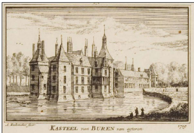
Kasteel van graafschap Buren 1719